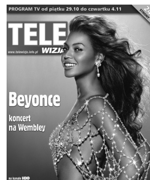
co tydzień programy 24 stacji TV